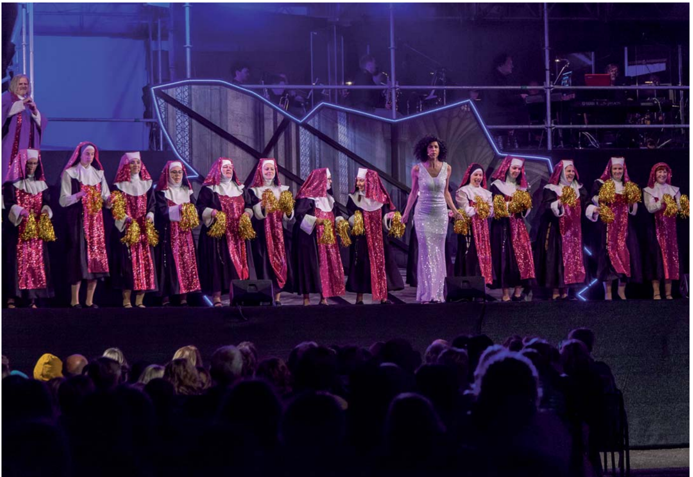
Ein kultureller Höhepunkt im Neckar-Odenwald-Kreis: Schlossfestspiele Zwingenberg